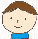
月齢24ヶ月以下で免疫不全