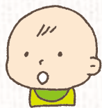
生後6ヶ月以下の乳児